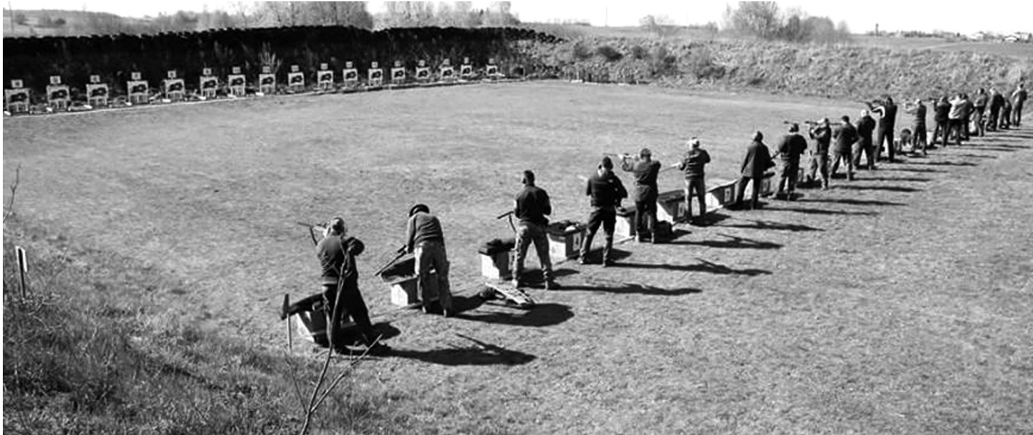
Pramoginis šaudymas tampa vis populiarenis.