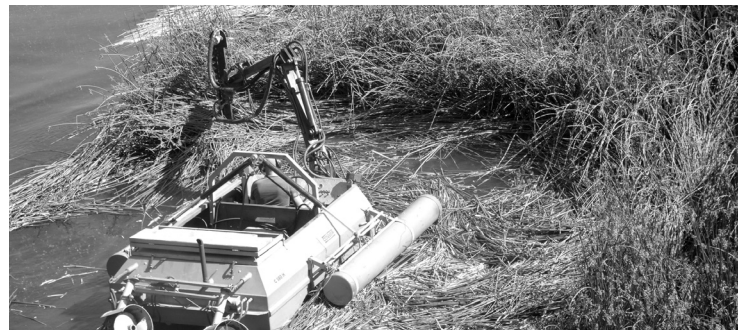
Prieš dvejus metus už Šventosios upės vagos šienavimą planuota sumokėti 10 tūkst. eurų.

Pasak R.Blazarėno, 2017-ųjų metų upės šienavimo paslaugos kaina buvo akstinas pirkti valdišką amfibiją-šienaplovę. „Jeigu iš tiesų upės šienavimas kainuoja tik