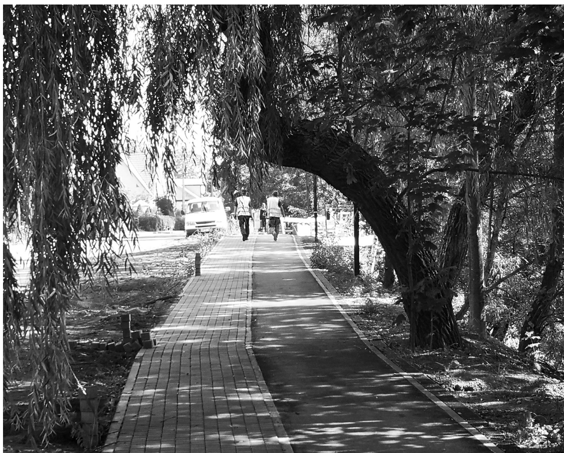
Urbanizuojamame dešiniame Šventosios upės krante darbininkai takus ties ir sienas statys iki pat žiemos pradžios.