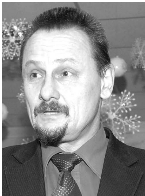
Anykščių rajono meras Sigutis Obelevičius apgailėstauja, kad už projektuotojų darbo broką niekas nėra atsakingas.