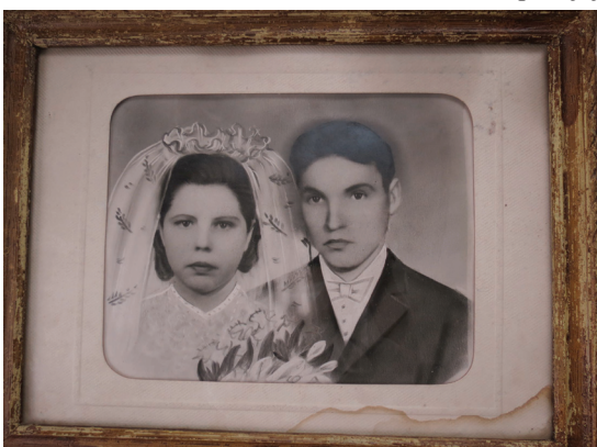
Nupiešta vestuvių dieną.

Su mama važiuodavom duonos pirkti į Panevėžį. Ten prisiperkam, tačkelę ( karutį - red. past. ) pasiskolinam, susivežam po maišą prie kelio, tada stabdom „gruzoviką“, iki Levaniškių atsivežam. Su mama iš Levaniškių pareinam pėsčios, tada pakinkom arklį ir atsivežam tuos kepalus. O juk septyni vaikai - pora savaičių, ir nebėra tos duonos... Aš buvau mamos padėjėja, užtat ir išmokau