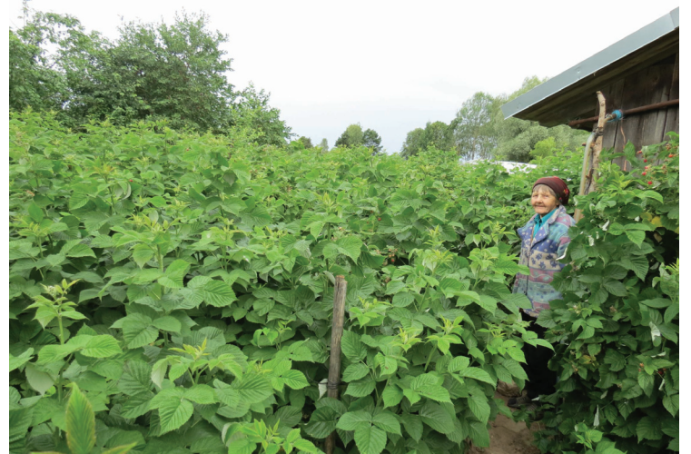
Avietės išsiplėtusios kaip miške.